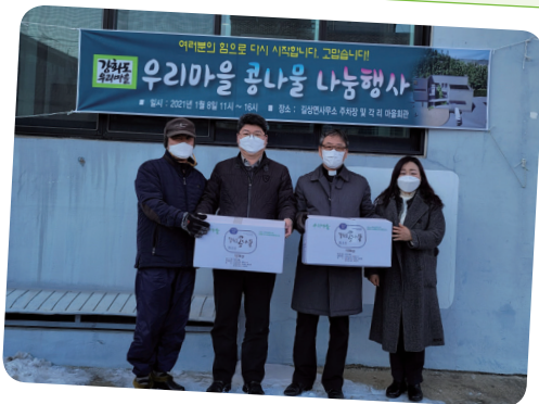
1. 8. 공나물 나눔행사