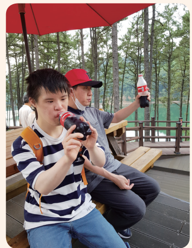
6. 28. 자연탐방