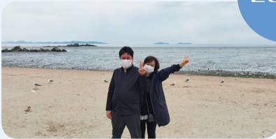
5. 20. 석모도 바다