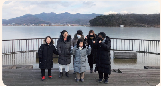
1. 1. 드라이브&산책