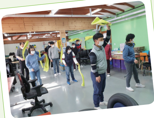
1. 5. 생활체육