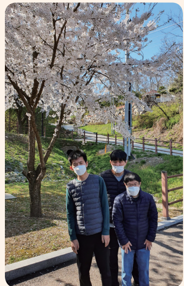
4. 8. 트레킹