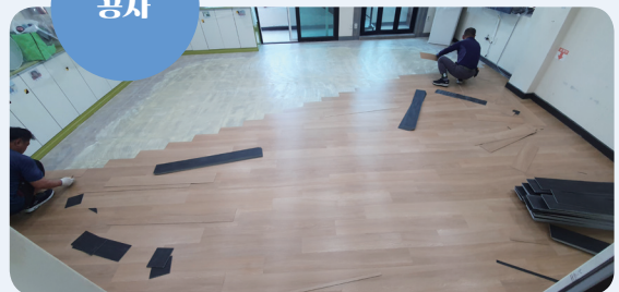
6. 19.~22. 포스트코로나 복지현장인프라강화사업(인천사회복지공동모금회지원)