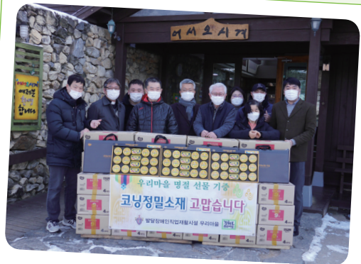
1. 28. 코닝정밀소재(주) 설선물 후원