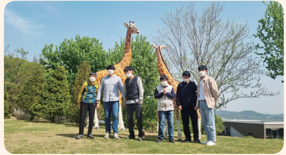
4. 29. 공동모금회사업 지역사회문화체험