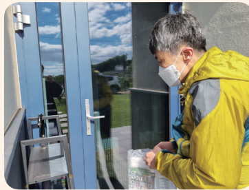
5. 17. 돌레주민홍보