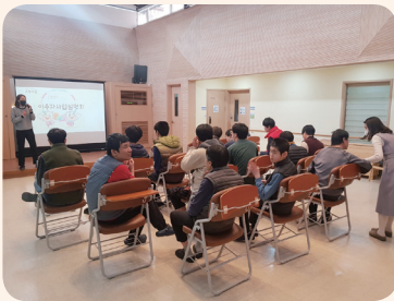
1. 27. 이용자 사업설명회