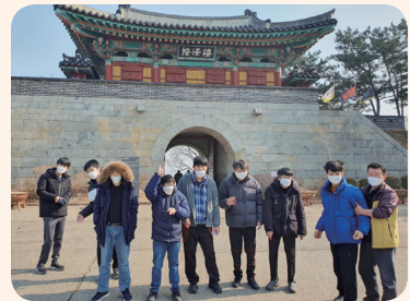
2. 13. 산책