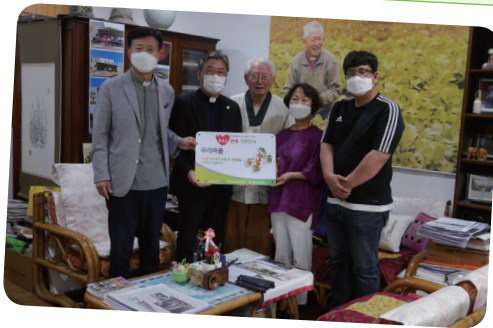
6. 25. '542번째 기부천사' 현판 전달