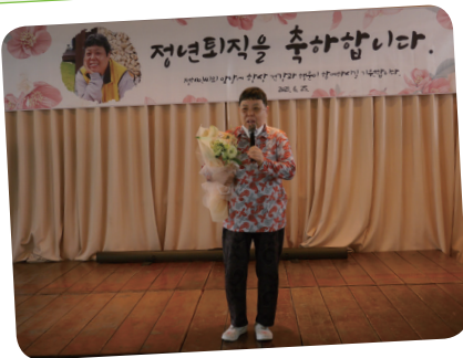
6. 25. 근로장애인 정년퇴직기념식