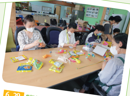
6. 29. 더리미미술관 '두근두근 예술여행'