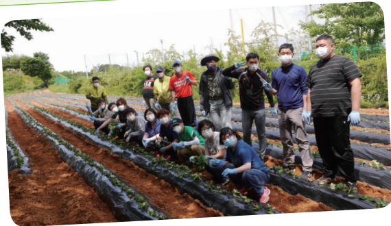
5. 26. 고구마 심기