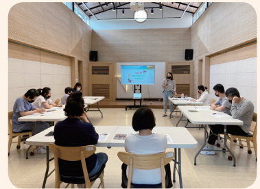
5. 26. 자치위원 역량강화교육