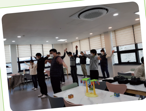
2. 23. 생활체육