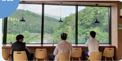
6. 17. 카페 이용