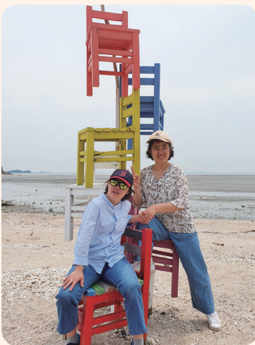
6. 8. 테마여행