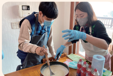
3. 25. 공동모금회사업 일상생활훈련