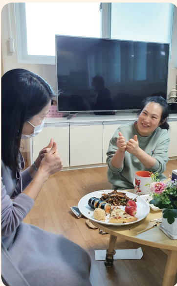
2. 22. 이용자 생일파티