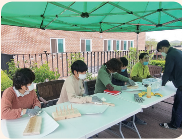
5. 6. 공동모금회사업 목공