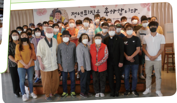
6. 25. 근로장애인 정년퇴직기념식