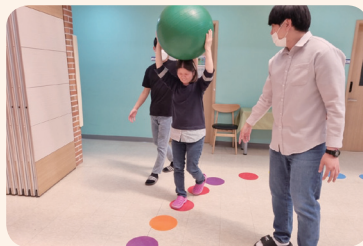
3. 22. 신체도식치료