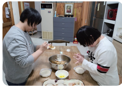
요리활동 김치만두 만들기