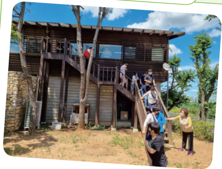
6. 16. 소방안전교육