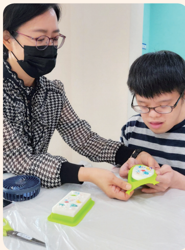
6. 8. 공동모금회사업 향초공예