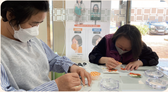
4. 13. 공동모금회사업 압화공예