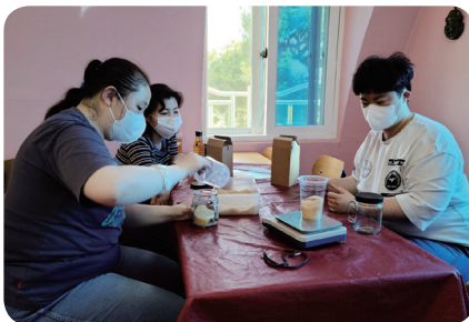
체험활동 무화과식초 만들기