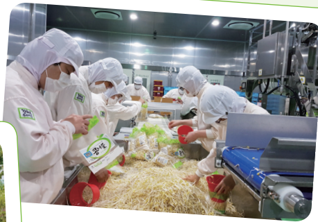
5. 25. 콩나물 수작업