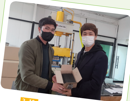
3. 10. 커피박재활용연필 첫 납품