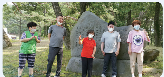
6. 29. 마니산 오르기