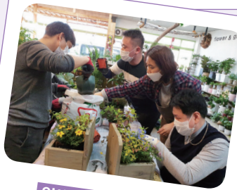
원예활동 화분 만들기